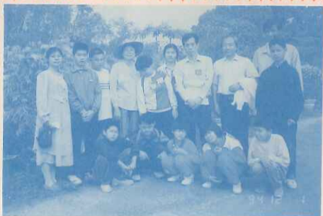
省立嘉義啟智學校教學資源中心諮詢服務專線服務人員合影